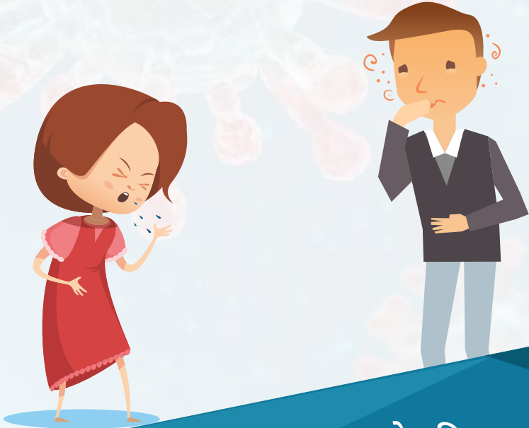
करोना विषाणू आजार

करोना विषाणू आजारावर कोणतेही औषध अथवा लस उपलब्ध नाही. रुग्णास त्याच्या लक्षणानुसार उपचार केले जातात.