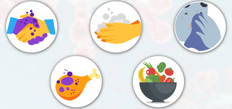
करोना विषाणू आजार