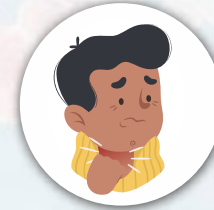
श्वास घ्यायला त्रास होणे