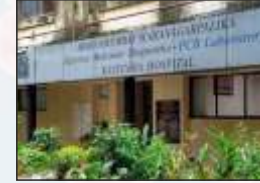
कस्तुरबा मध्यवर्ती प्रयोगशाळा मुंबई