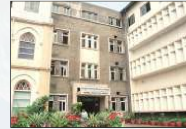
राष्ट्रीय विषाणू विज्ञान संस्था (एन आय व्ही), पुणे