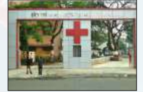
इंदिरा गांधी वैद्यकीय महाविद्यालय नागपूर